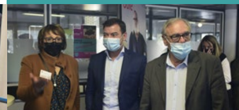
Personnalités présentes (gauche à droite)*