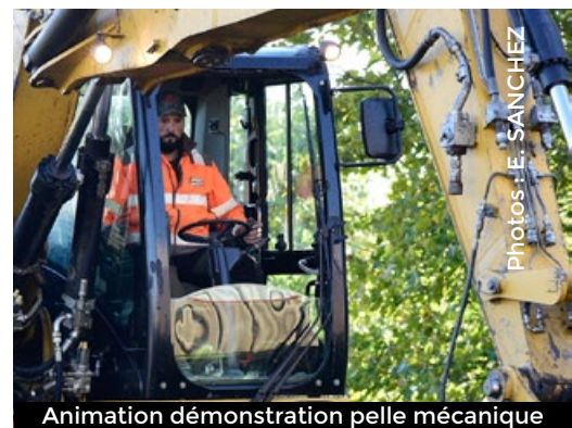
Animation démonstration pelle mécanique

“ + de 70 entreprises et associations proposant environ 480 offres d'emploi ”