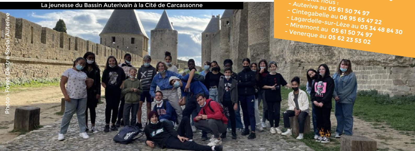
La jeunesse du Bassin Auterivain à la Cité de Carcassonne