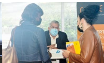
Atelier Création entreprise