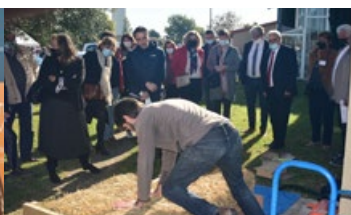
Animation isolation paille