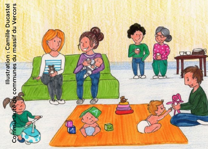
Illustration : Camille Ducastel Communauté de communes du massif du Vercors