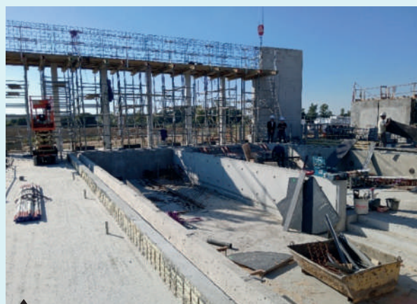
16 octobre 2025 (élévation façade ouest).