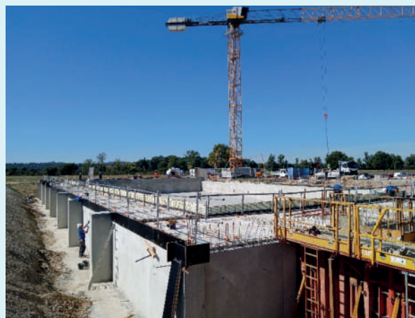
2 octobre 2025 (coulage du grand bassin).